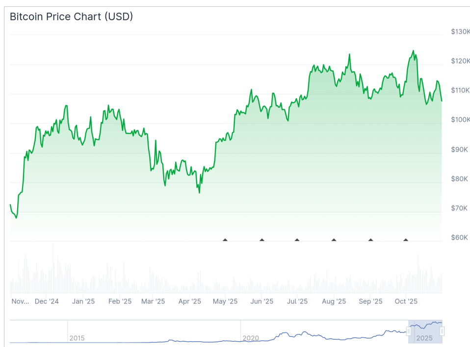
Рис. 1: Динамика цены биткойна за последние 12 месяцев (USD).

Доля биткоина в общей капитализации крипторынка осталась в районе 60%, подтверждая его статус основного защитного актива на фоне альткоинов.